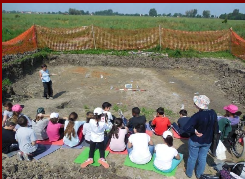
Su concessione del Ministero dei Beni e delle Attività Culturali e del Turismo – Soprintendenza per i Beni Archeologici dell'Emilia Romagna, riproduzione vietata