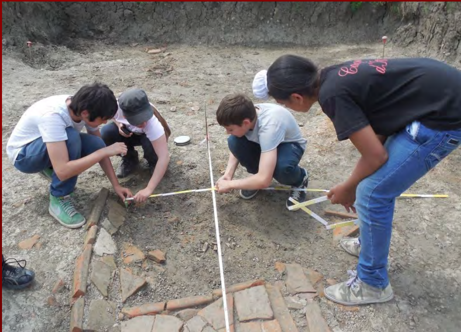
Su concessione del Ministero dei Beni e delle Attività Culturali e del Turismo – Soprintendenza per i Beni Archeologici dell'Emilia Romagna, riproduzione vietata